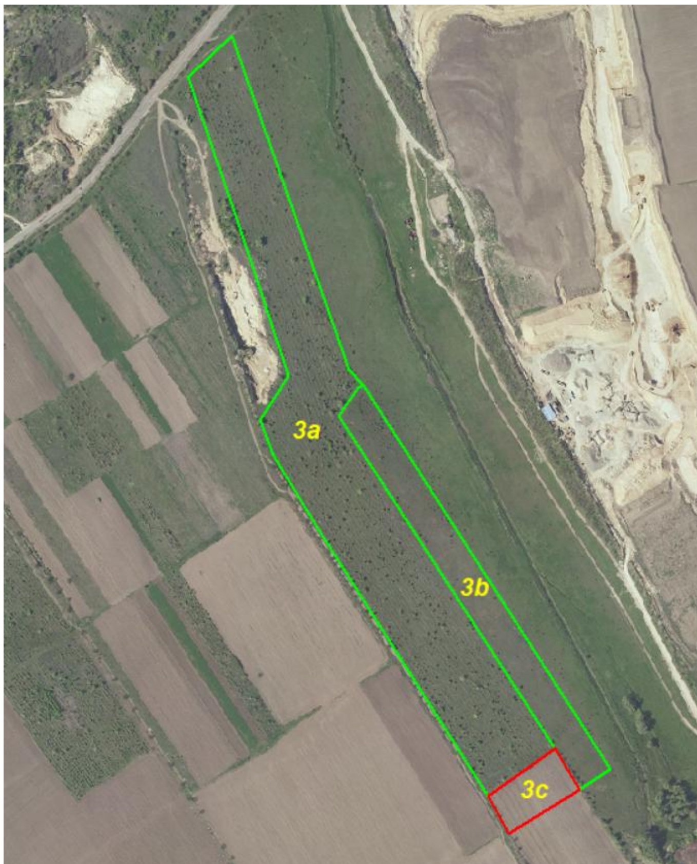
Schița unității de cultură forestieră 3c.