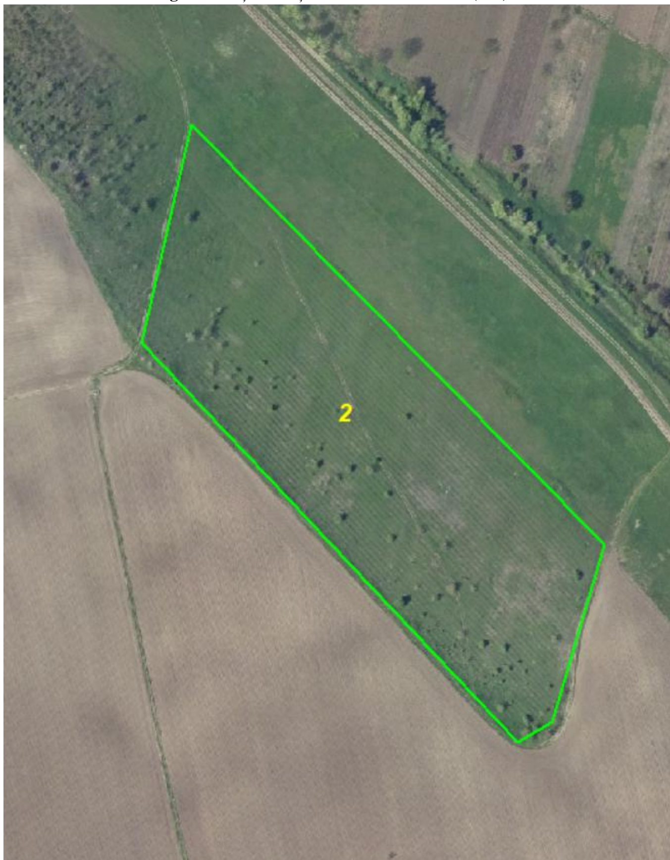
Fig. 2 - Schița unității de cultură forestieră (Ucf) 2.