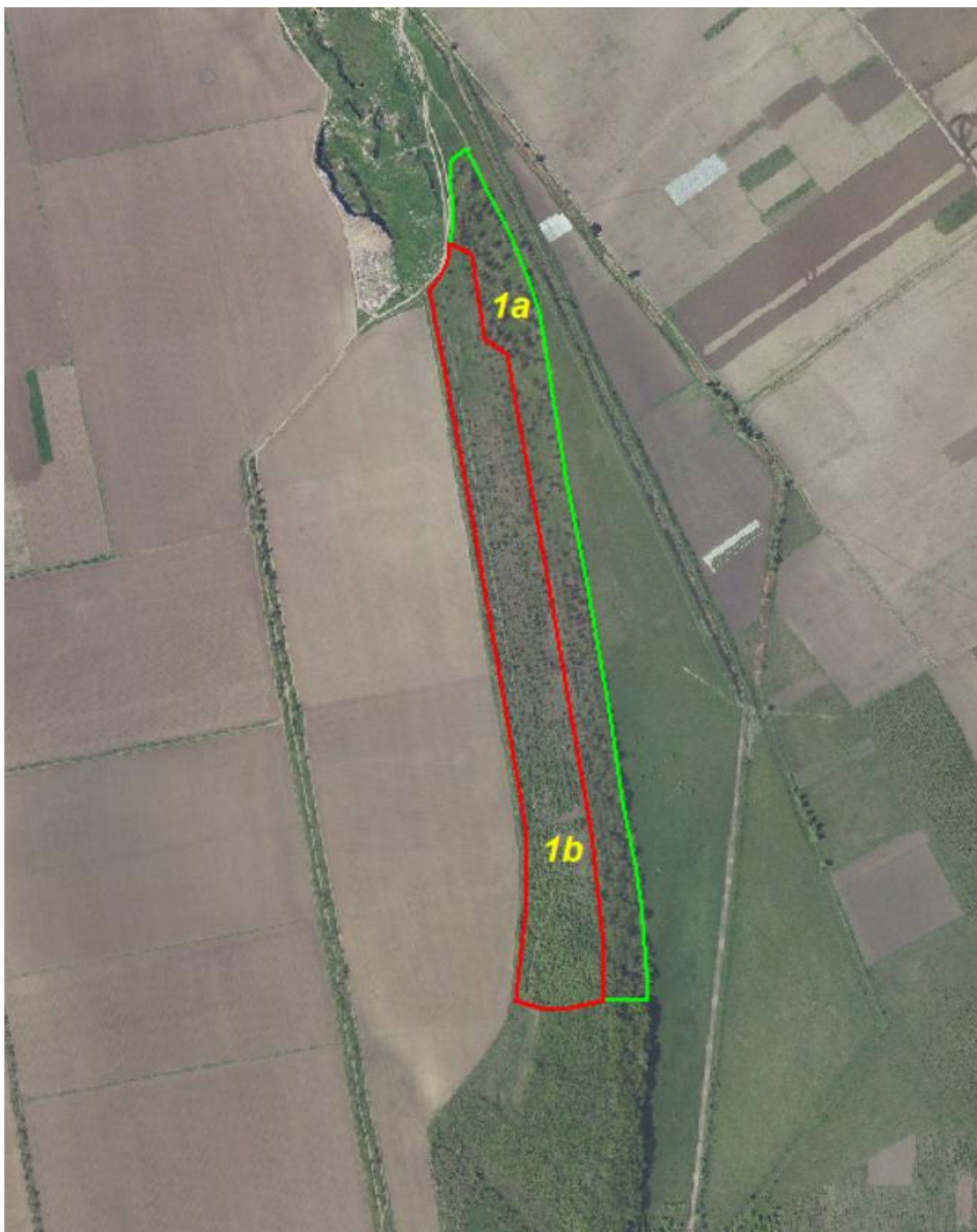
Schița unității de cultură forestieră 1b.