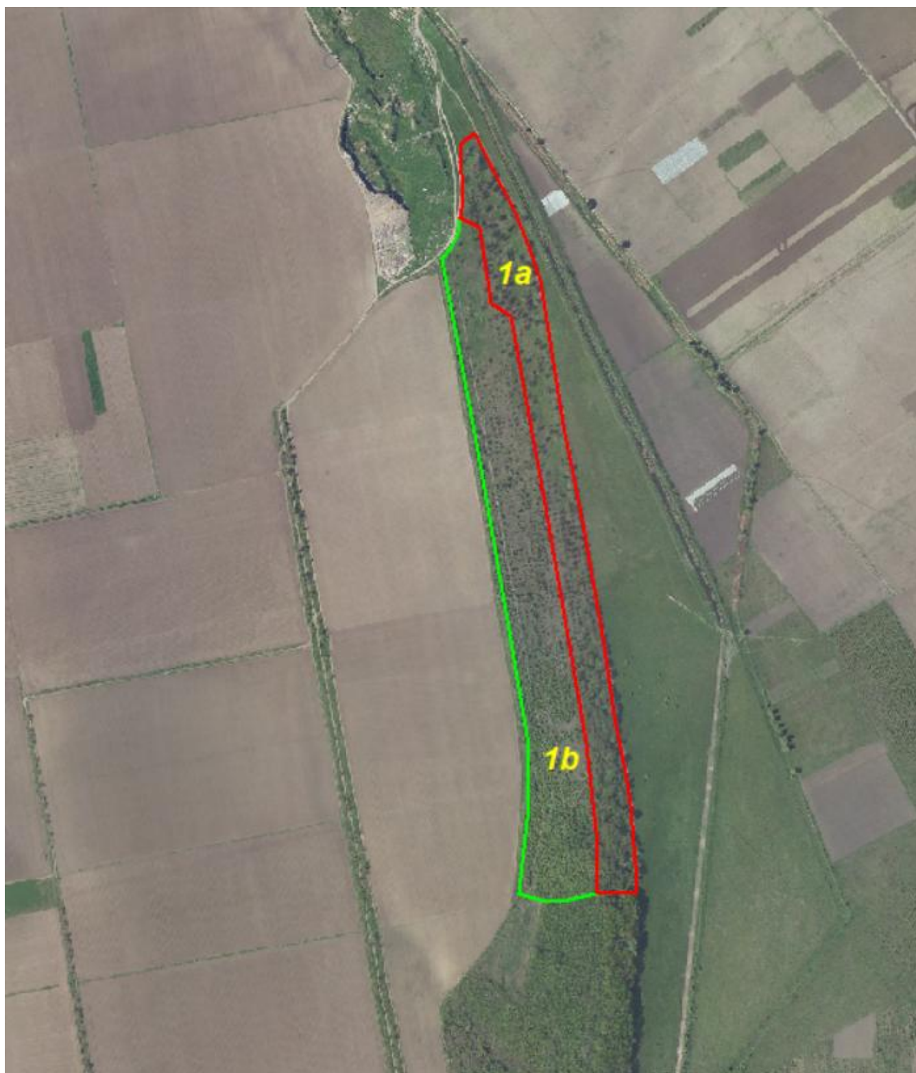
Schița unității de cultură forestieră 1a.