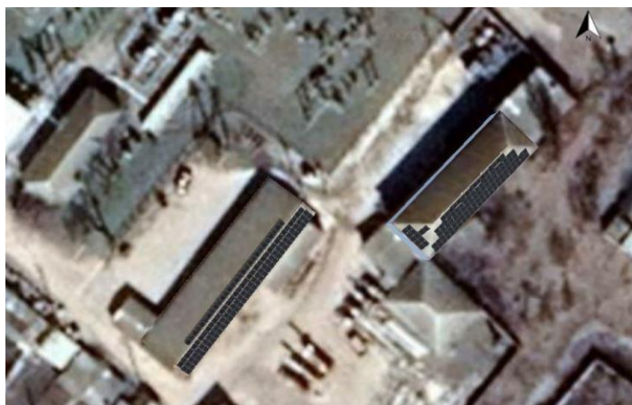
Fig.2 CEPV nr.2. oficiul raional Dondușeni Adresa: or. Dondușeni, str. Vasile Alecsandri nr.102 Puterea instalată – 90kW