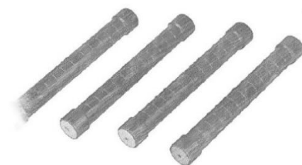
Fig.3.1 Clemă analogic cu MJPT

Cleva de conectare „analogic cu MJPT” permite efectuarea unei conexiuni puternice și fiabile a conductorilor din aluminiu. Se fixează prin presare.