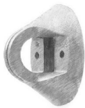
Fig.2.1 Analogic cu SO279 material plastic