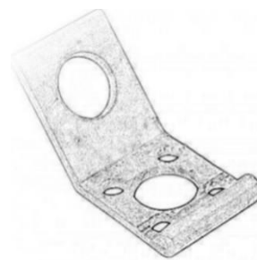
Fig.2.2 Analogic cu CA25 material:

Metal zincat la fierbinte sau Oțel inoxidabil