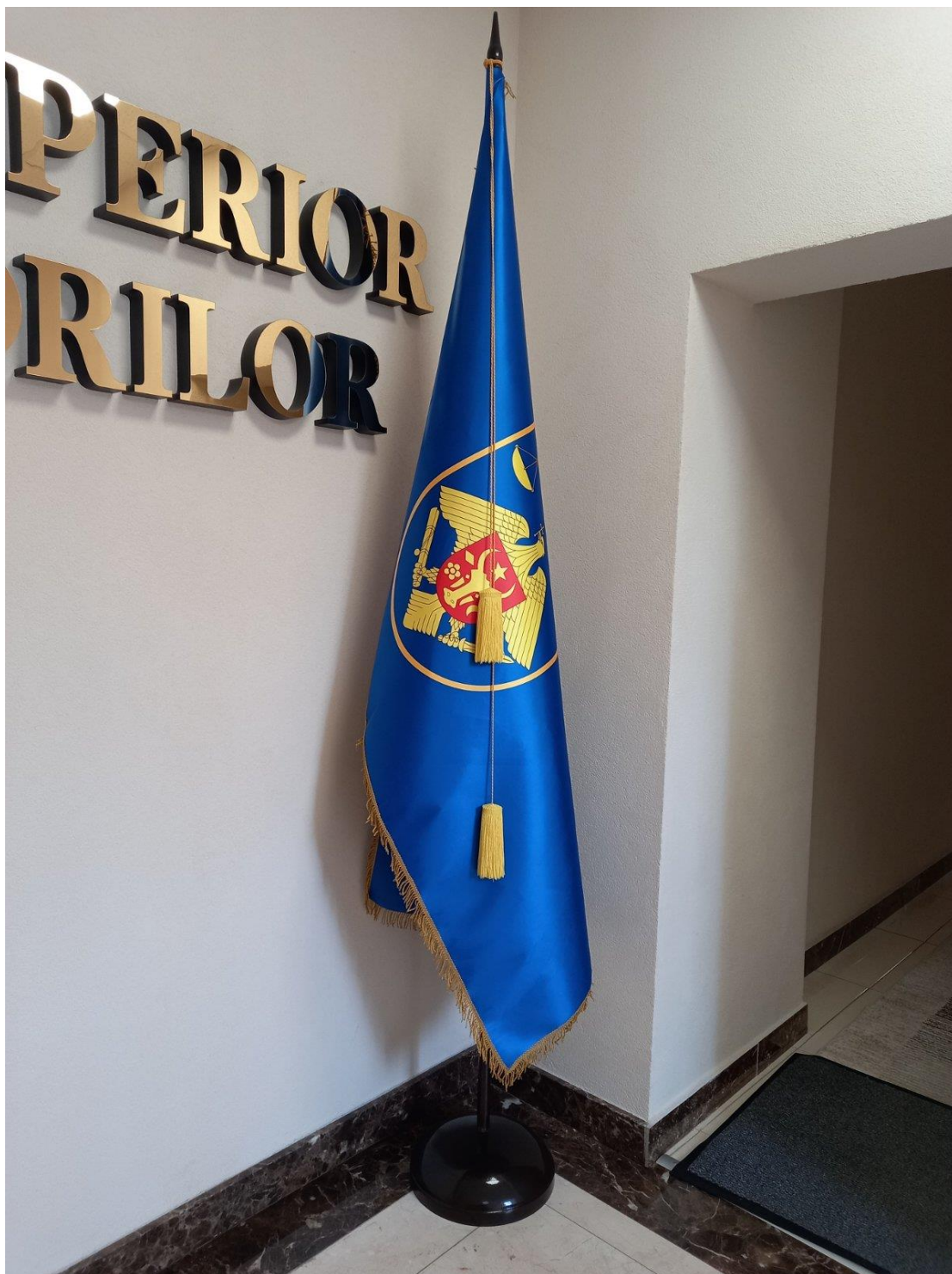
Exemplu pentru poziția 6 din caietul de sarcini.