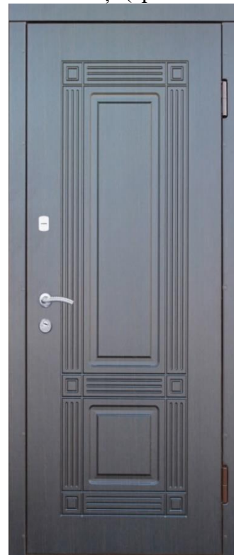
Foto: Ușă metalică cu două plăci din MDF

Aspectul modelului frezat pe suprapuneri MDF ar trebui să fie coordonat cu beneficiarului înainte de semnarea contractului. Modelul ușii(aproximativ).