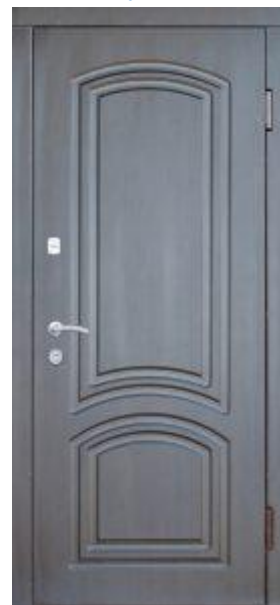
Foto: Ușă metalică cu două plăci din MDF.