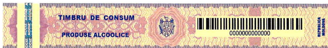
Fig. 2 Aspect grafic al timbrului de consum pentru producția alcoolică introdusă pe teritoriul Republicii Moldova și destinată a fi consumată pe teritoriul necontrolat de autoritățile constituționale va avea următorul design.