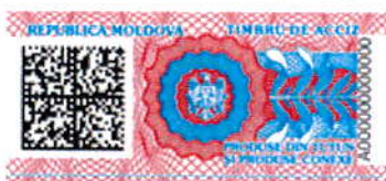
Varianta nr. 1