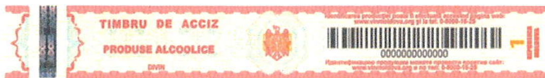
Fig. 1 Aspect grafic al timbrului de acciz pentru producția alcoolică pentru agenții economici din Republica Moldova