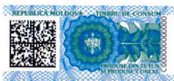
Varianta nr. 1