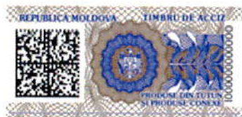
Varianta nr. 1