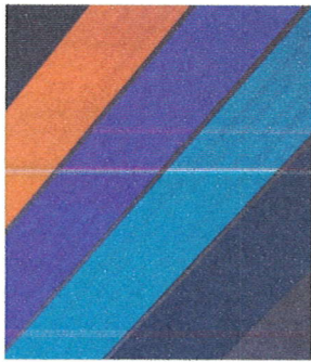
Solid & Fluorescent*