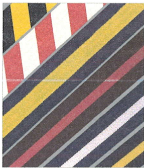
Striped and Chevron*