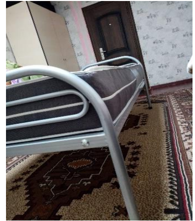
Foto: Un set de dormitor pentru elev/student cu un loc de dormire la 1900 mm x 750 mm