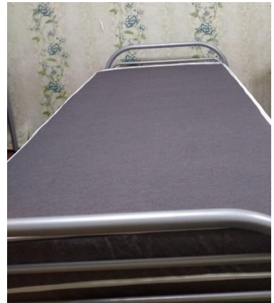
Foto: Un set de dormitor pentru elev/student cu un loc de dormire la 1900 mm x 750 mm