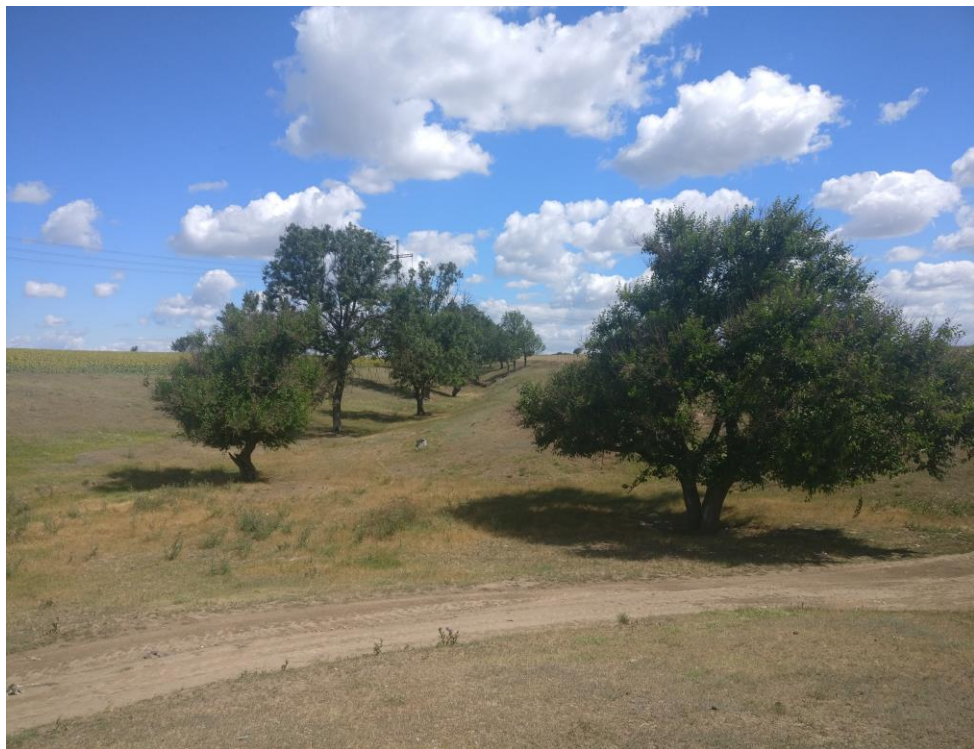
Fig. 5.2.3. Terenul proiectat. Vegetație preexistentă