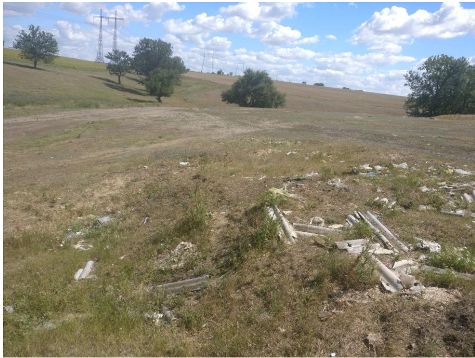
Fig. 5.2.2. Terenul proiectat. Aspect general