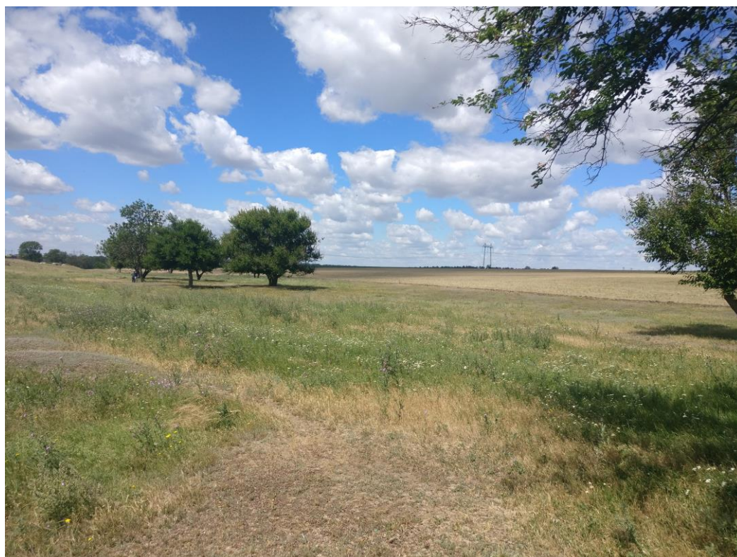
Fig. 5.2.5. Terenul proiectat. Detalii privind vegetația preexistentă