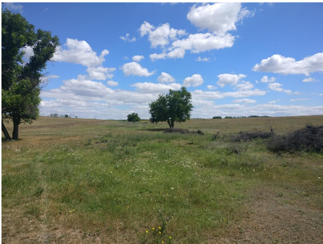
Fig. 5.2.4. Terenul proiectat. Condiții staționale