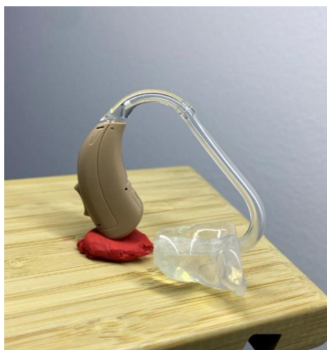
Olivă cu tub obișnuit

Vezi mai jos simulare din soft-ul producătorului care ilustrează secvențe din programul de reglaj, aceste aparate au posibilitate să fie reglate cu tub subțire și olivă individuală.