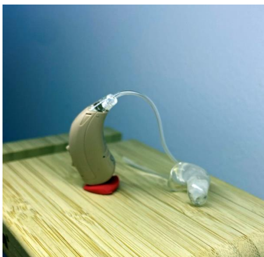
Olivă cu Thin Tube

Dat fiind faptul că, pentru aceste poziții sunt cerute aparate auditive cu dimensiuni minimale, Acustmed mai oferă și tubul subțire, pentru un cosmetic mai atrăgător. La aceste modele de aparate auditive poate fi ajustat tubul subțire ( Thin Tube ) cu diferite tipuri de olive (insertii): deschisă, semideschisă, închisă, dublă și desigur oliva individuală . În toate aceste cazuri caracteristicile tehnice ale aparatului auditiv nefiind schimbate. Adică rămân cele care sunt indicate în fișa de date tehnice la rubrica Tipul / Thin Tube 3.0 / ear simulator – IEC 118-0.