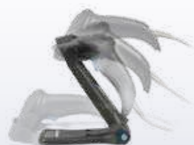
STD-QW20-BK Держатель/Подставка, чёрная