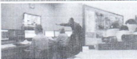
Centru de monitorizare