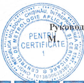
Схема сертификации 3. Надзор осуществляется ОСП ГП ЦПМС один раз в год. Сертификат действителен только в случае обеспечения информацией на государственном языке каждой упаковки продукции в соответствии с действующим законодательством. Договор № 5383/2018 от 04.09.2018. Дело № 1130.