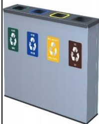
Imagine cu titlu orientativ