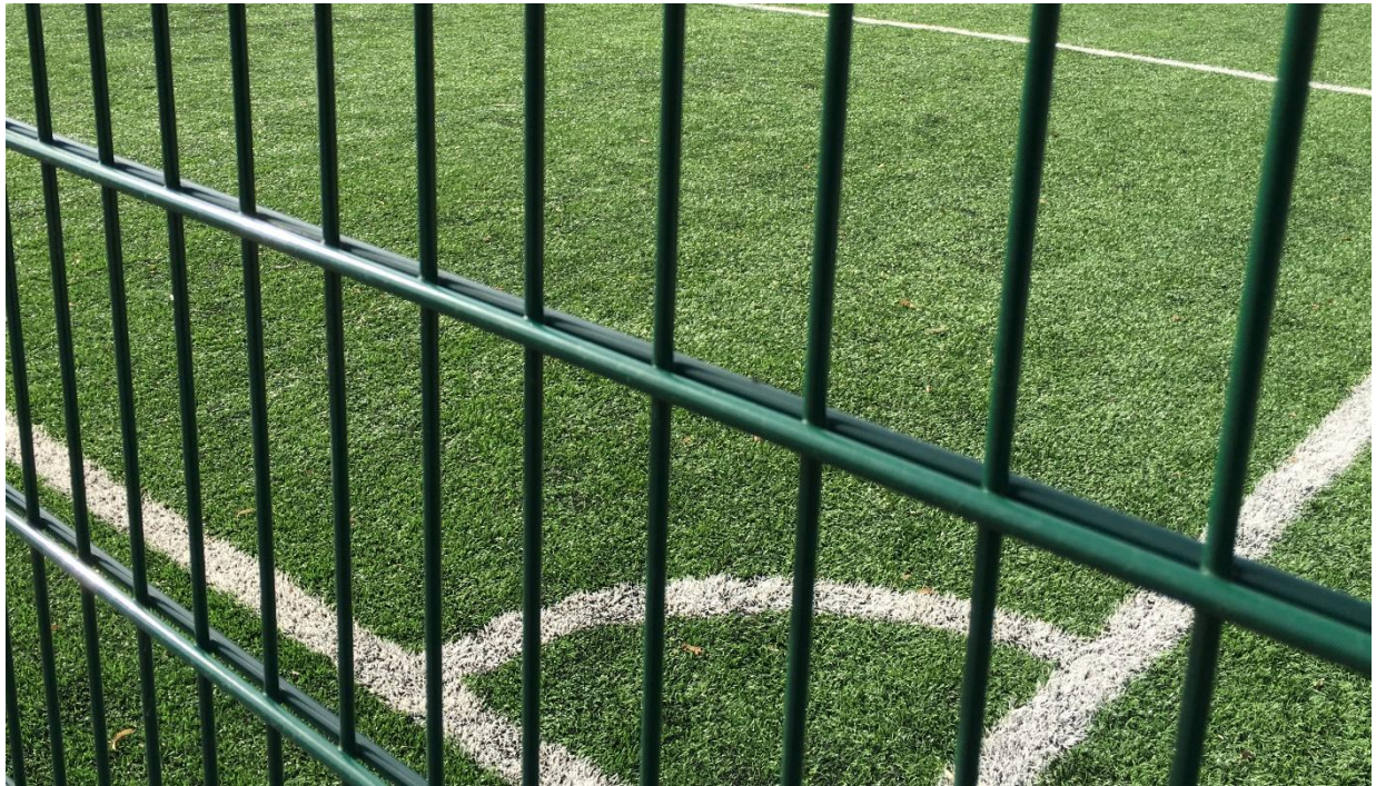
Teren de tenis