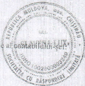
Notă informativă privind veniturile și cheltuielile clasificate după natură