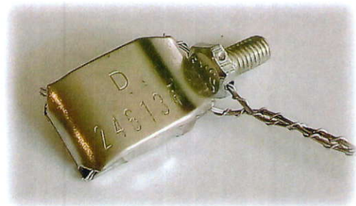
Figure 1. – General view and overall dimensions of manufacturer's seals with individual number