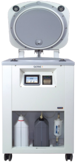
SOLUSCOPE SERIE 1 PA

A se utiliza exclusiv cu Soluscope Serie 1 PA