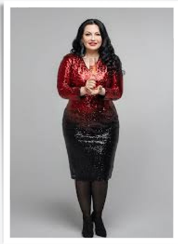
GETA BURLACU + BAND