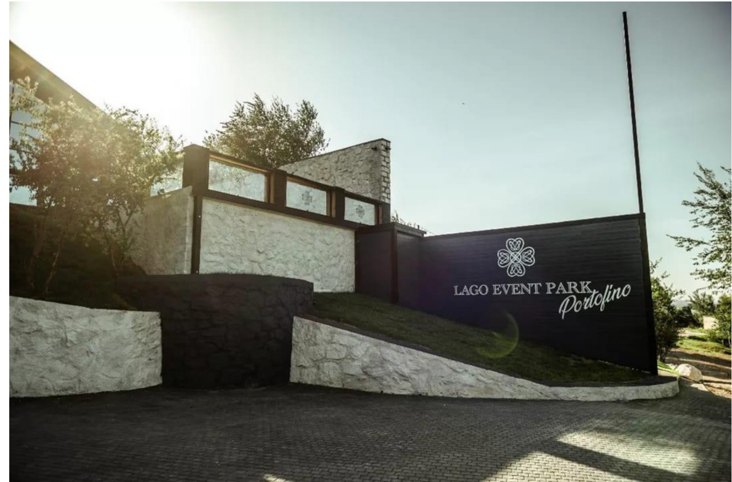
Lago Event Park