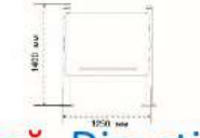
Dimensiuni echipament (L x l x h)

SCHEMĂ DE MONTAJ Echipamentul reprezintă o tablă pentru desen cu creta, destinată utilizării în spații exterioare, contribuind la dezvoltarea creativității și activităților educative ale copiilor.