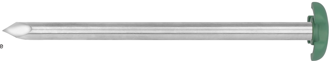
Passende Trokardorne Suitable trocar spikes