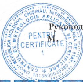
Схема сертификации 3. Надзор осуществляется ОСП ГП ЦПМС один раз в год. Сертификат действителен только в случае обеспечения информацией на государственном языке каждой упаковки продукции в соответствии с действующим законодательством. Договор № 5383/2018 от 04.09.2018. Дело № 1130.