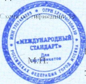
Схема сертификации: 1