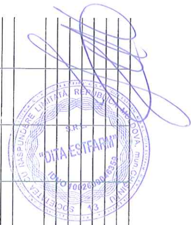
Tabelul 2 Creanțe, investiții financiare și datorii pe termen lung aferente nereșidenților, cu excepția fondatorilor

Rd.010 = rd.020 + rd.030 + rd.040 + rd.050 Rd.060 = rd.070 + rd.080 + rd.090 + rd.100 Col.7 = col.3+col.4+col.5+col.6