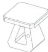
Free standing concrete chair

Materials used: Fiber and fiber reinforced concrete Surface treatment: Stone exposed aggregate with UV resistant varnish Seat: Polished concrete with UV resistant varnish