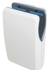
AA24050 8427950360596 Белая отделка