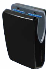
AA24650 8427950360619 Черная отделка