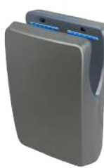
AA24950 8427950360626 Отделка графитового цвета