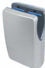
AA24550 8427950360602 Серебристая отделка