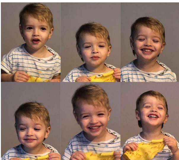
Figura 2 Emoții pozitive

Satisfacție, Eforie, Mândrie, Speranță, Amuzament, Serenitate, Uimire, Optimism, Compasiune, Încredere, Afecțiune, etc., surprinse de fotografi in chipurile oamenilor din Moldova.