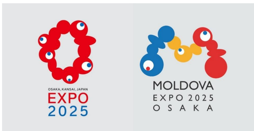
Figura 1 Logoul EXPO 2025 Osaka, si logoul Moldovei pentru aceasta expozitie.

Inspirație de logo-ul japonez pentru Expo 2025 Osaka, cercurile roșii ale căruia reprezintă celule vii sau un lanț de ADN pentru a reprezenta „strălucirea vieții”, am dezvoltat un logou al Moldovei pentru acest EXPO, prin care vrem sa reprezentam esența moldovenilor si a Moldovei, care se zbat între est si vest si teritoriul cărora a fost mereu subiect de interes și influență a țărilor vecine, dar care au rezistat în timp si care-și doresc un viitor prosper.