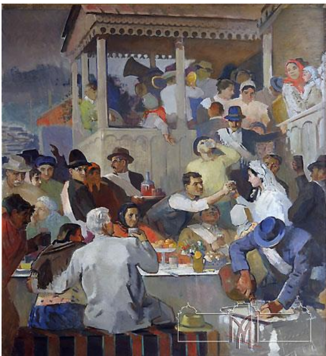
Figura 3 Sainciuc Glebus, 1919-2012, Masa mare, 1960, ulei, panză, 225x230

Masa mare este locul unde moldovenii se cunosc mai bine, acolo ei împart bucuriile și tristețile, savurează din bucatele tradiționale, dar și meditează asupra vieții și viitorului.