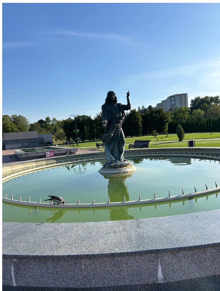
Poza efectuata din IM Parcul Dendrariu, mun. Chisinau.