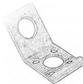
Fig.2.2 Analogic cu CA25 material Metal zincat la fierbinte sau Oțel inoxidabil