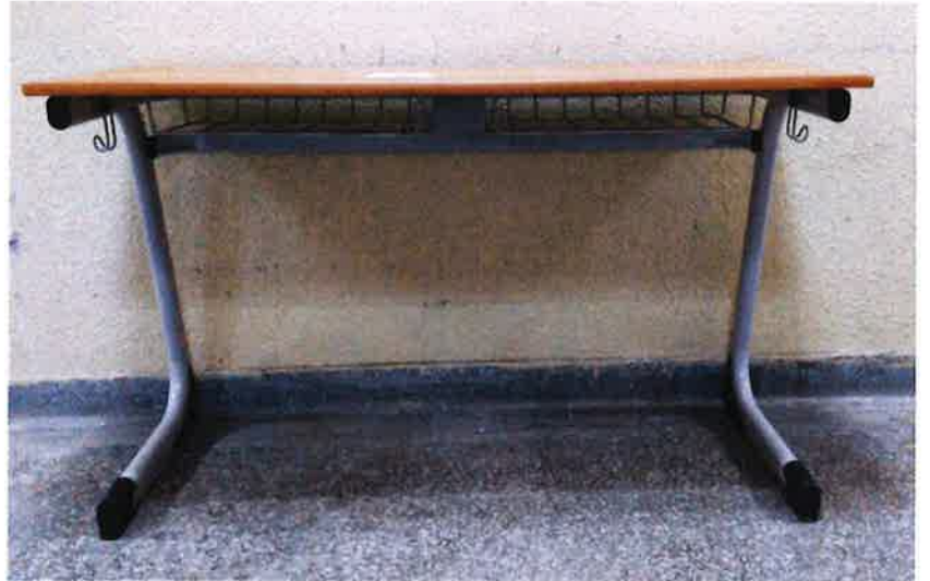
DENEY NUMUNESİ FOTOĞRAFLARI