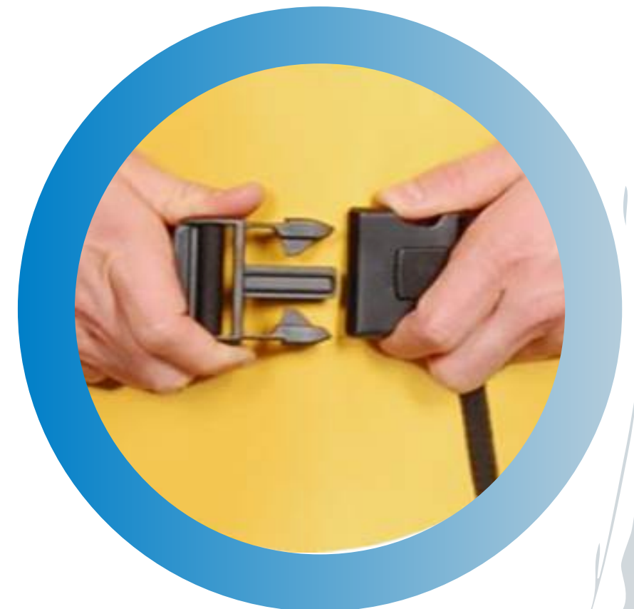
Buckle Belt Closure