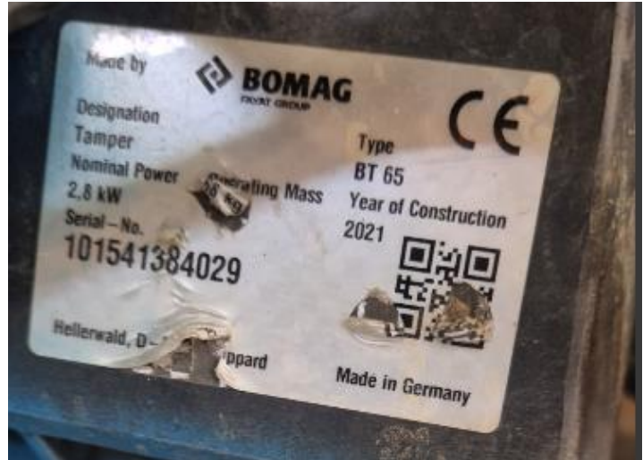
16. Compactor 700 kg – Contract locatiune - nr.16/PJ – 29.03.2024