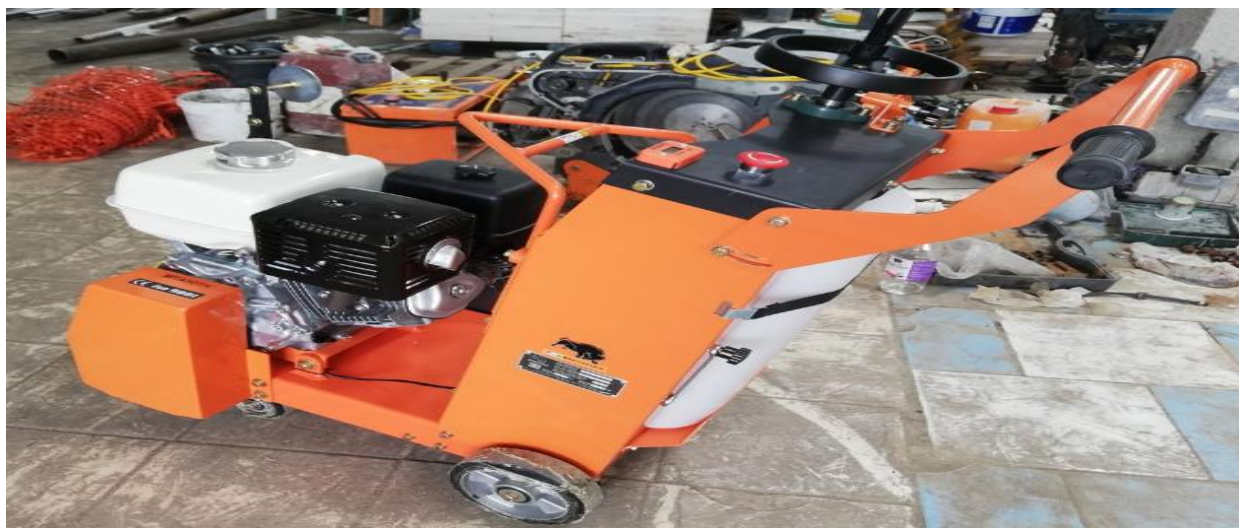
22. Masina de taiat rosturi in beton – nr.16/PJ – 29.03.2024