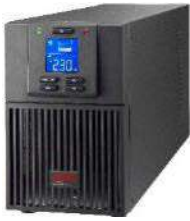
Easy UPS 1K & 2K Tower

References: SRV1KI, SRV1KIL, SRV1KRI, SRV1KRIRK, SRV1KRIL, SRV1KRILRK, SRVPM1KIL, SRVPM1KRIL, SRV2KI, SRV2KIL, SRV2KRI, SRV2KRIRK, SRV2KRIL, SRV2KRILRK, SRVPM2KIL, SRVPM2KRIL, SRV3KI, SRV3KIL, SRV3KRI, SRV3KRIRK, SRV3KRIL, SRV3KRILRK, SRVPM3KIL, SRVPM3KRIL, SRV6KI, SRV6KIL, SRV6KRI, SRV6KRIRK, SRV6KRIL, SRV6KRILRK, SRVPM6KIL, SRVPM6KRI, SRVPM6KRIL, SRV10KI, SRV10KIL, SRV10KRI, SRV10KRIRK, SRV10KRIL, SRV10KRILRK, SRVPM10KIL, SRVPM10KRI, SRVPM10KRILSPM1KL, SPM2KL, SPM3KL, SPRM6KL, SPRM10KL, SPRM1KL, SPRM2KL, SPRM3KL, SRV36BP-9A, SRV72BP-9A, SRV36RLBP-9A, SRV72RLBP-9A, SRV192RBP-7A, SRV192RBP-9A, SRV240BP-9A, SRV240RLBP-9A