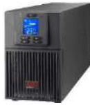
Easy UPS 1K & 2K Tower