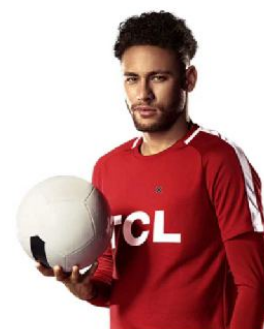
Ambasador de brand Neymar Jr.