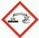
GH 05 - Coroziv

Fraze de pericol: H 302: Nociv in caz de inghitire. H 315: Provoaca iritarea pielii. H 317: Poate provoca o reactie alergica a pielii. H 318: Provoaca leziuni oculare grave. H 290: Poate fi coroziv pentru metale.