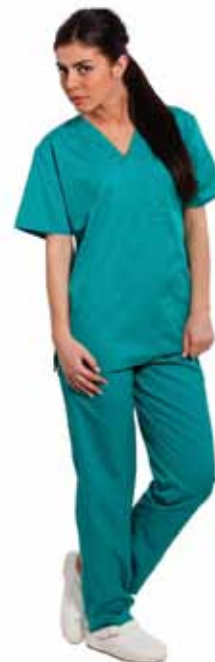
Costum - De Vara - Unisex