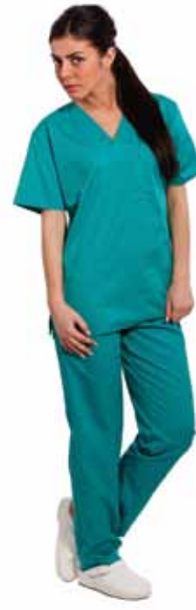
Costum - De Vara - Unisex