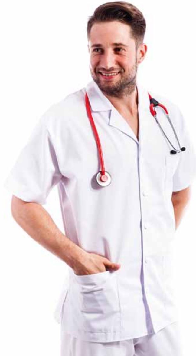
Costum Clasic cu Revere