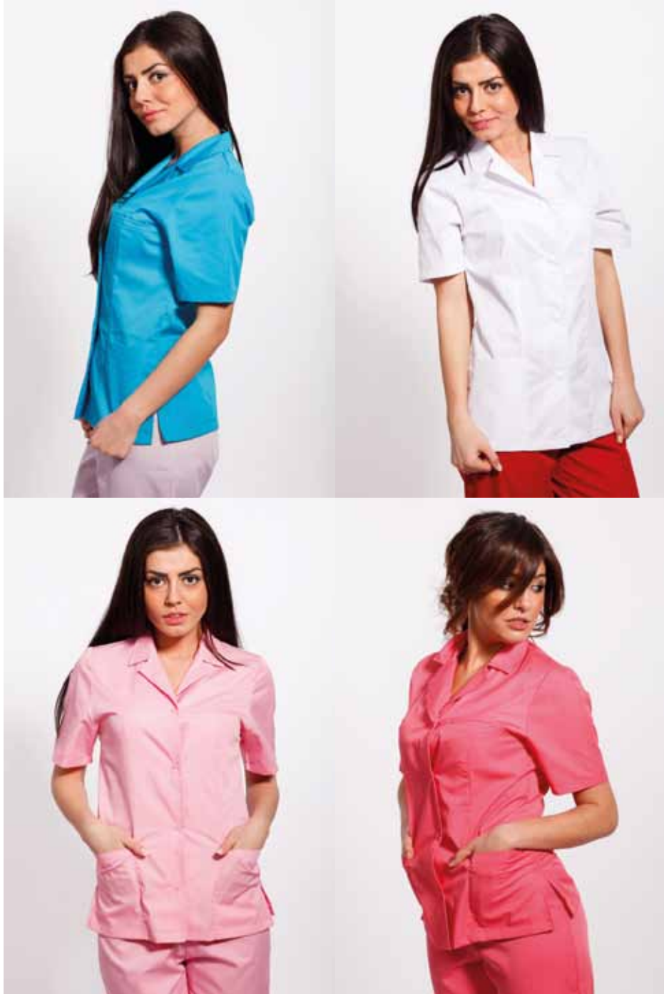
Bluza Dama cu Revere