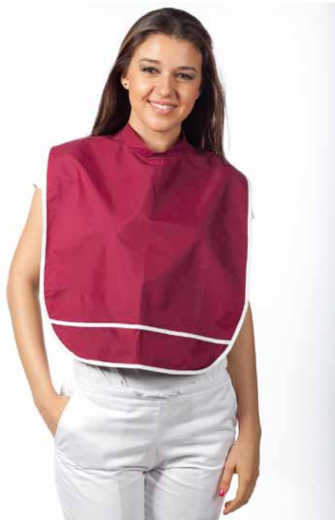
Bavete Protectie Stomatologie