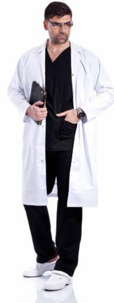
Halat Barbatesc 34 cu Revere