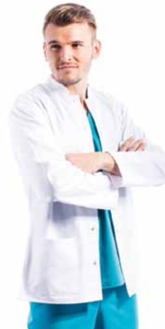
Tunica Maneca Lunga