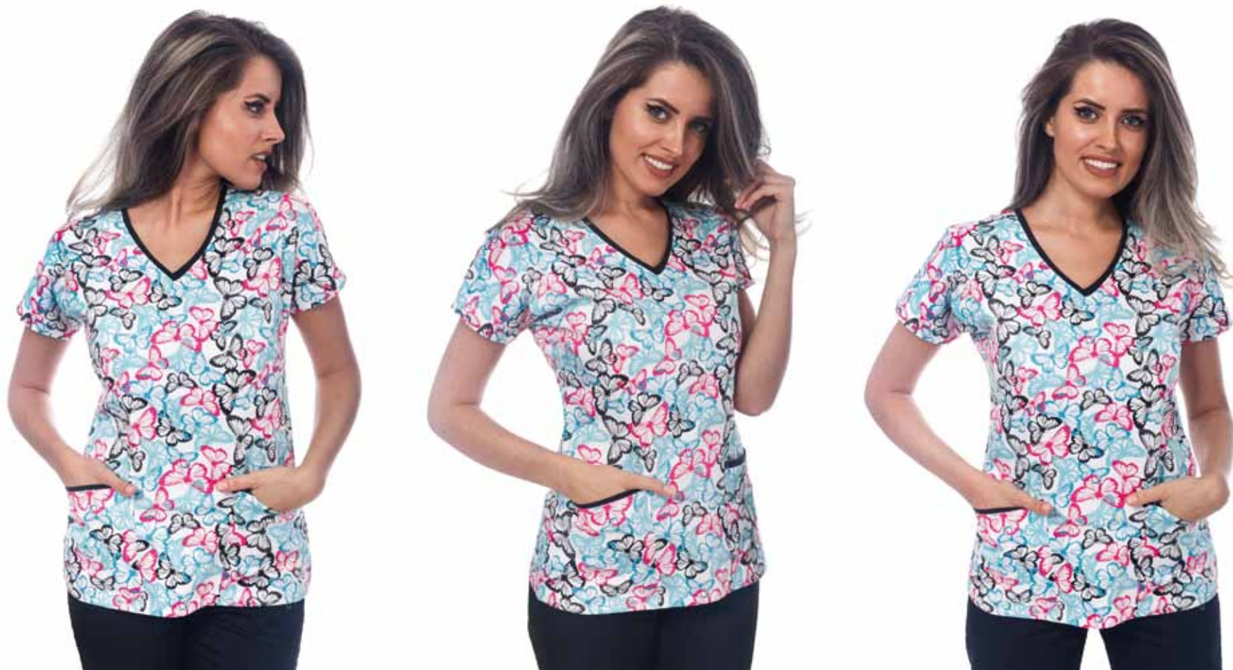
Bluza Imprimata - White Tropical Butterflies