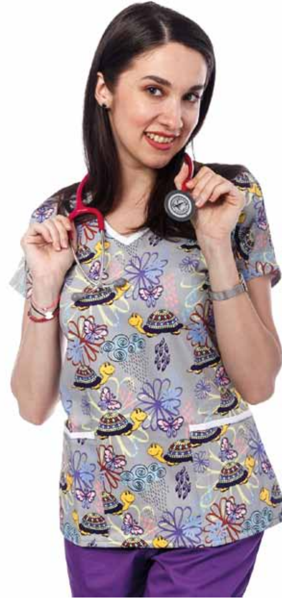
Bluza Imprimata - Grey Turtles