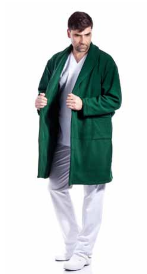
Halat Sezon Rece - Polar