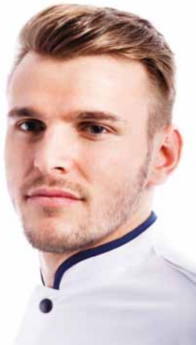
Tunica Maneca Scurta cu Bordura Colorata