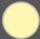
illuminazione alogena halogen light

Emissione luminosa a spettro solare Durata del diodo Led 45.000 ore Consumo di corrente ridotto ad 1/20 Flusso luminoso equivalente a 170 W Assenza di calore generato Assenza di fibre ottiche Silenziosità nel funzionamento