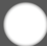
illuminazione Power Led System Power Led System light