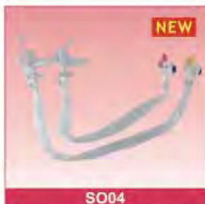
Enclosed Sputum Suction Tube Size: 6Fr-16Fr blister packing: 6Fr-8Fr 45cm 10Fr-16Fr 60cm