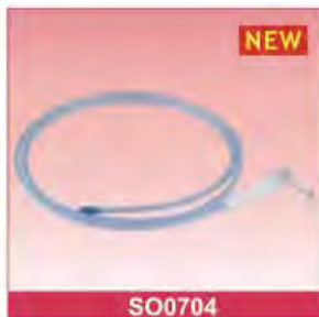
Ryle's Tube Size: 6Fr-22Fr With detectable X-ray polybag packing Tube Length: 110cm