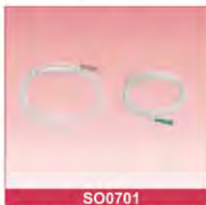
PVC Stomach Tube / Ryles Tube Size: 6Fr-20Fr With or without detectable X-ray Polybag or blister packing