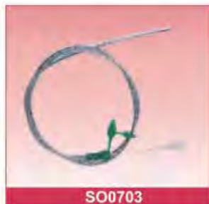
PU Stomach Tube Size: 6Fr-18Fr With detectable X-ray Blister packing