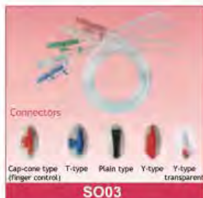
Suction Catheter Size: 5Fr-24Fr With or without detectable X-ray Polybag or blister packing