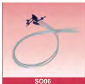
Umbilical Catheter Size: 6Fr-10Fr With or without detectable X-ray Polybag or blister packing