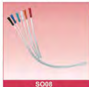
PVC Nelaton Catheter Type: Universal, Female, Male Size: 6Fr-24Fr (Universal) 6Fr-24Fr (Female) 8Fr-18Fr (Male) With or without detectable X-ray Polybag or blister packing