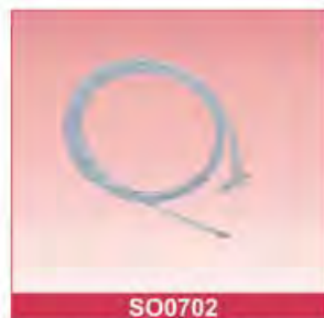
100% Silicone Stomach Tube Size: 6Fr-20Fr Tube length: 1.2m, With detectable X-ray Blister packing