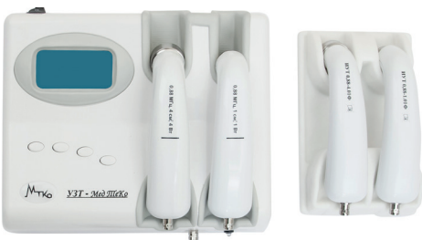
УЗТ 1.3.03Ф-Мед ТеКо