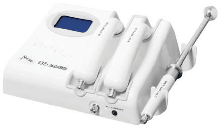
УЗТ 1.02.С-Мед ТеКо