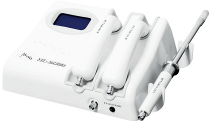
УЗТ 1.02.У-Мед ТеКо