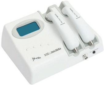
УЗТ 1.02Ф-Мед ТеКо