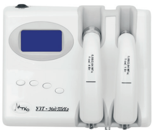
УЗТ 1.3.02Ф-Мед ТеКо