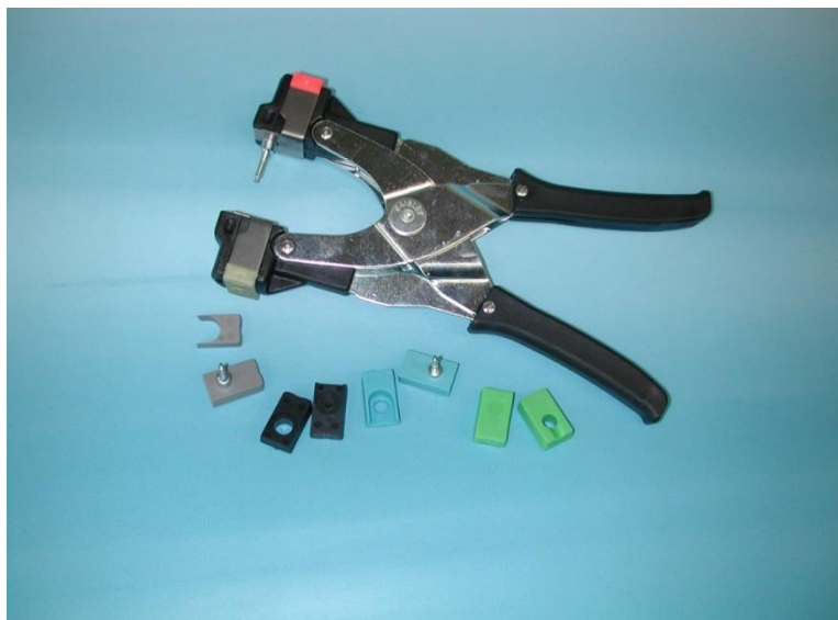
Fig. 4: Aplicatorul universal pentru aplicarea crotaliilor MultiFlex

Cerințele tehnice sunt condiții obligatorii pentru Participanți și sînt incluse în criteriile de evaluare a licitației.