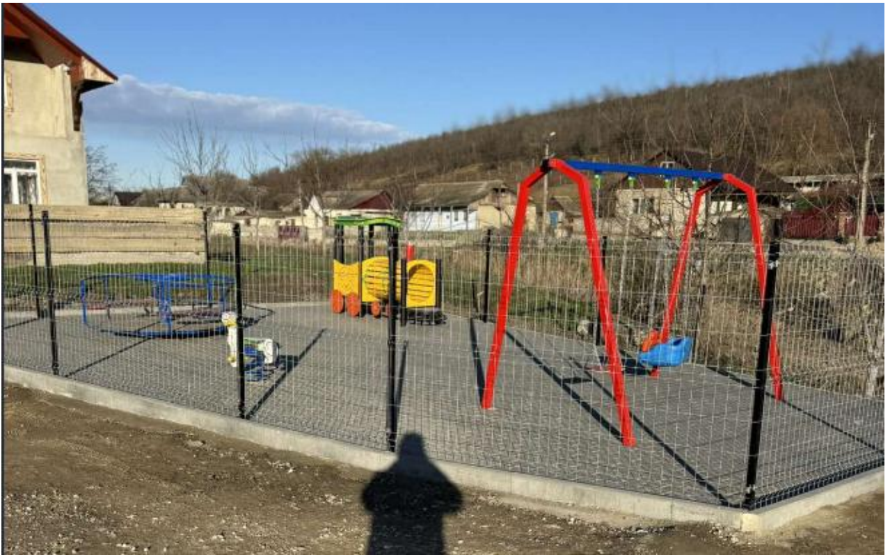
Terenul de joacă din Or. Causeni, str. Alba Iulia