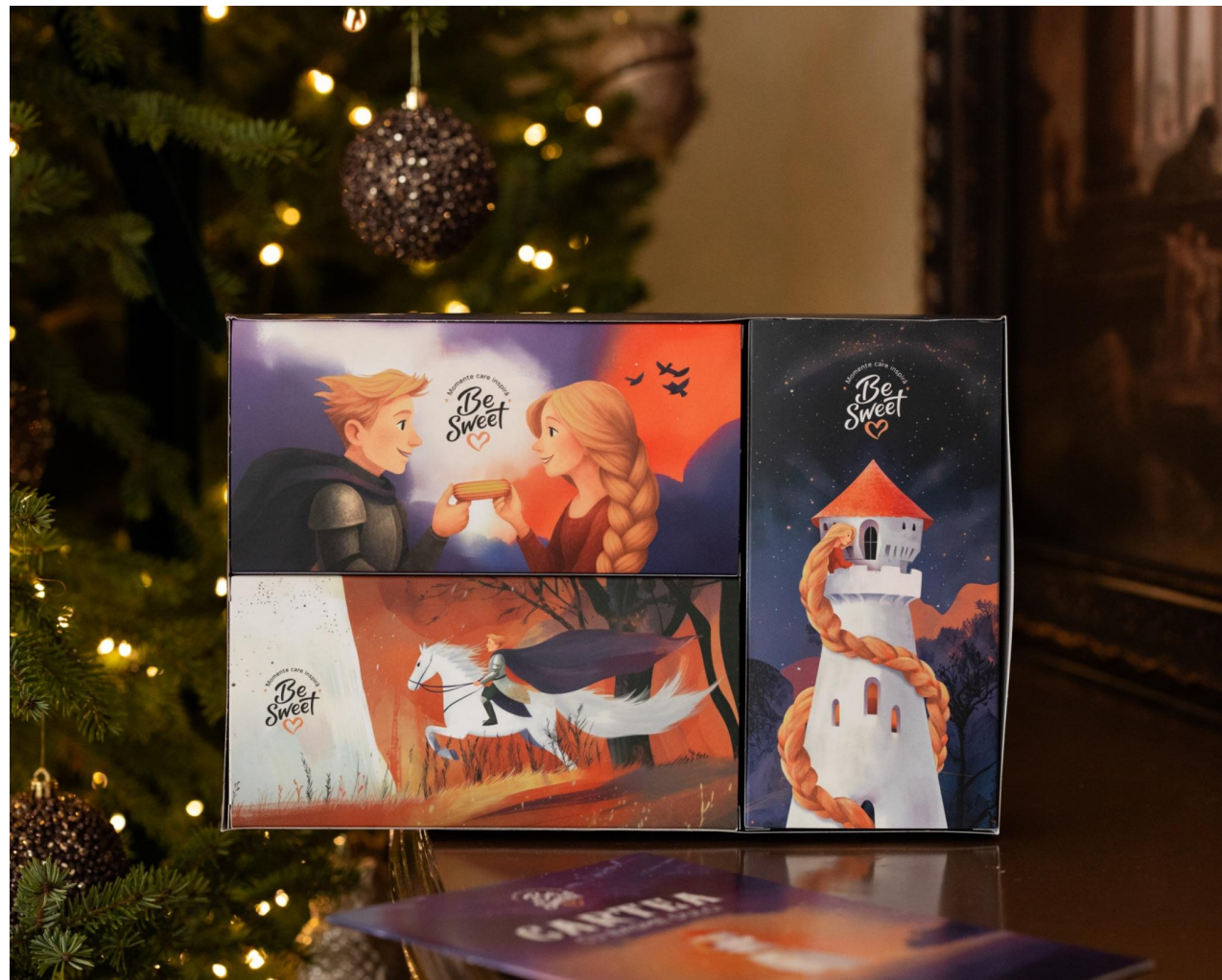
Ședință foto de produs