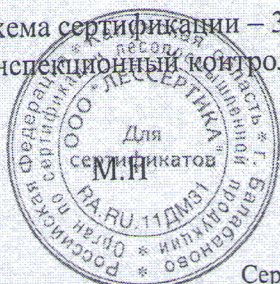
Схема сертификации – Зс. Инспекционный контроль – октябрь 2021 года, октябрь 2022 года.