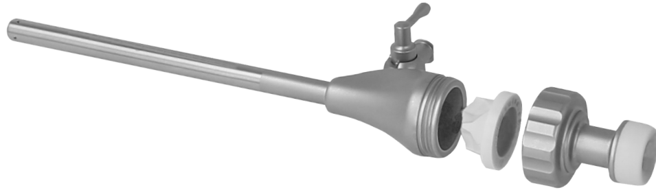
Trokare, ohne Dorn Trocars, without spike