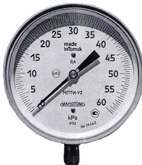
Figura 1. Vederea generală a manometrelor tip МПТИ

Manometrele au dispozitiv de corectare a zeroului pe carcasa acestora.