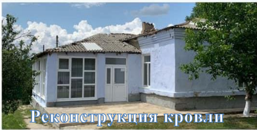
Реконструкция кровли детского сада с.Исерлия