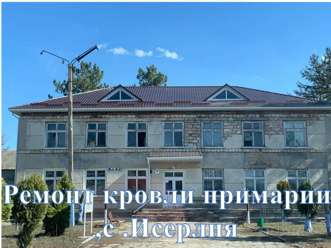
Ремонт кровли примарии с.Исерлия