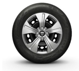
15" oțel, design Elma