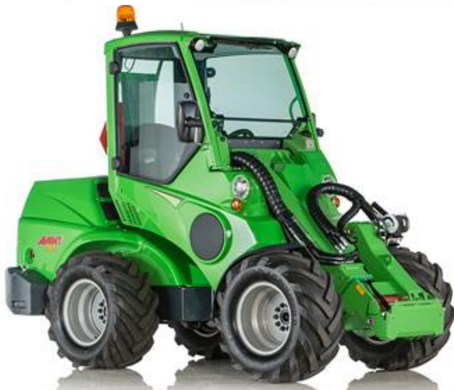
Pozele atasate au caracter ilustrativ