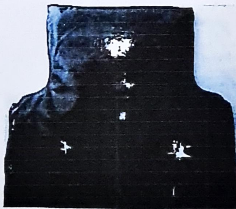
Fig. 2 Vestă balistică de protecție completă (fața îmbrăcată)