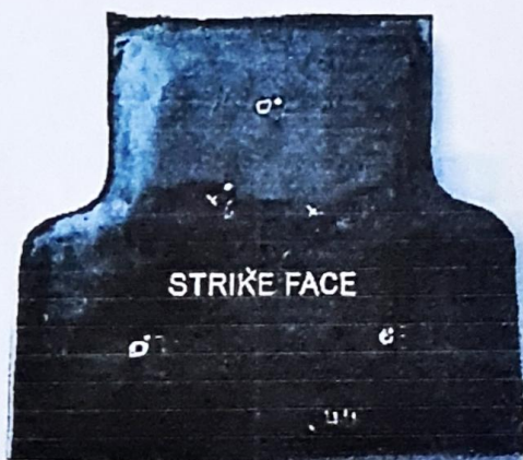
Fig. 1 Vestă balistică de protecție completă (fața de lovire)