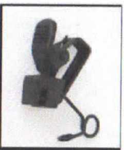
HC-11-1 Holder Clip