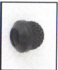
WS-11 Metal Windscreen