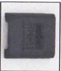
RM-11-BK Rubber Mount black